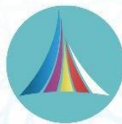
Taraqqiyot strategiyasi markazi