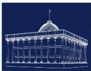
O'zbekiston Respublikasi Oliy Majlisi Qonunchilik palatasi