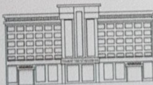
TIBBIYOT NASHRIYOTI MATBAA UYI

NASH.lits. AA № 8798 «TIBBIYOT NASHRIYOTI MATBAA UYI» MЧЖ Toshkent shahri, Olmazor tumani, Shifokorlar, 21