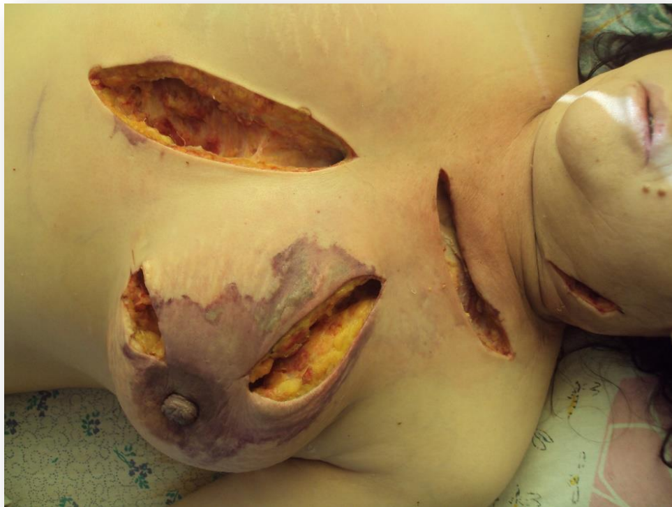
Рисунок 3. Некроз поверхностной фасции с тромбозом тканей молочной железы и подкожно-жировой клетчатки.

На этом фоне больная взята на операцию. Операция проводилась под внутривенной анестезией. Больной проведено вскрытие очагов в области грудины, молочной железы, надключичной области слева и шеи (рисунок 3).