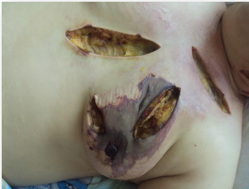
Рисунок 6. Отграничение процесса с сохранением некротического процесса.

На фоне проводимой консервативной терапии локально санации с ФарГАЛСом.