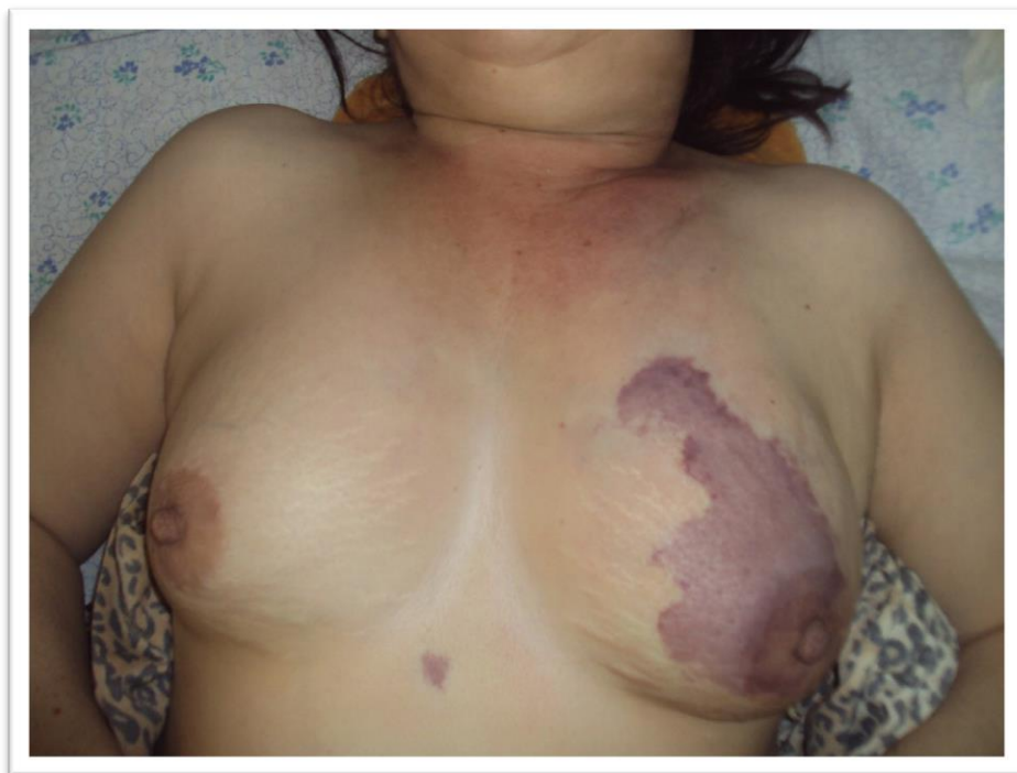
Рисунок 1. Внешний вид больной в день поступления.

Локально: при осмотре отмечается небольшая асимметрия молочных желез, за счет увеличения левой молочной железы.