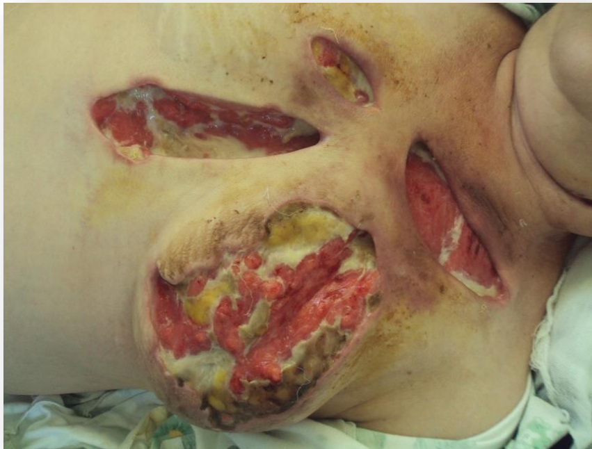
Рисунок 7. Вид раневого процесса на 6 сутки, после проведенной некрэктомии.

Локальная санация продолжалась с применением мази Офломелид, двухкратно в день. На 10 сутки пациента была выписана на амбулаторное лечение в удовлетворительном состоянии, с вялогранулирующей раной и рекомендациями по дальнейшему ведению раневого процесса.