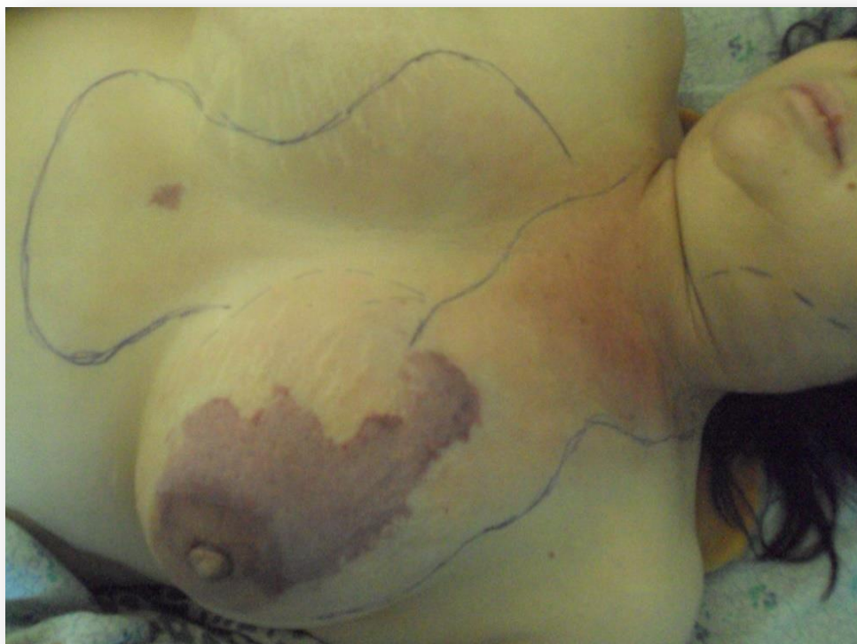
Рисунок 2. Границы выявленных измененных тканей (выделены маркером).

Границы уплотнения захватывают ткани грудины и переходят на боковую поверхность шеи слева. При этом визуально ткани не изменены. Характерных признаков воспаления не выявлено. Отмечалось увеличение шейных и подмышечных лимфоузлов слева. Правая грудь без особенностей.