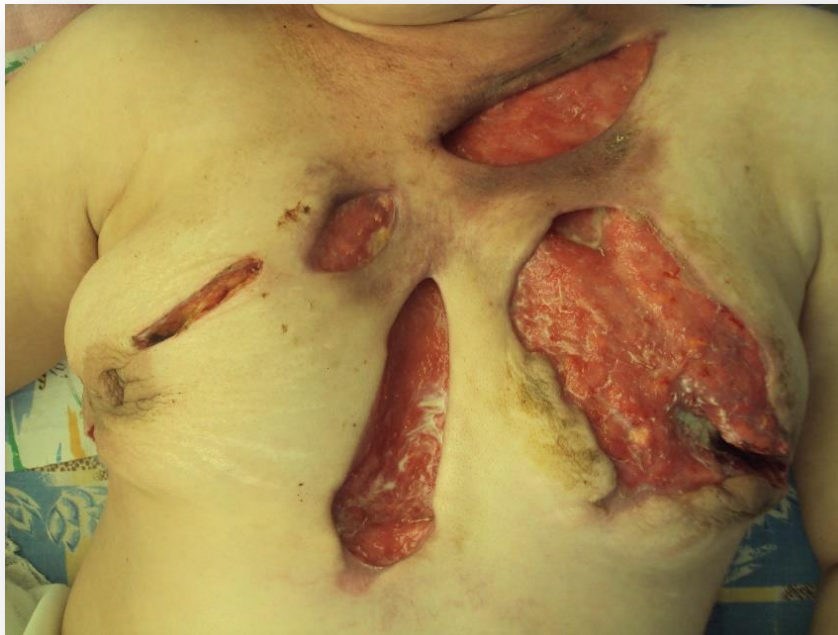
Рисунок 8. Рана чистая, имеется активная грануляция.

На 30 сутки, при очередном осмотре рана полностью эпителизирована, однако имеется грубый послеоперационный рубец (рисунок 9).