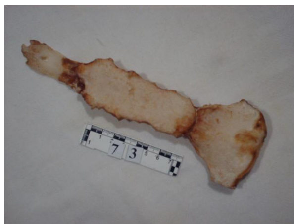
2-расм. Тўш суяги сегментларининг суякланган ҳолати