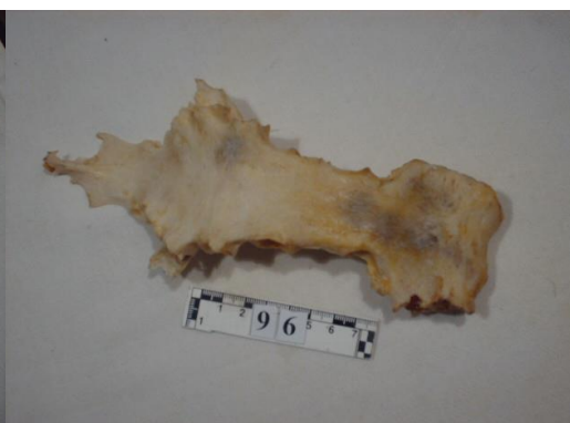
7- ва 8-расмлар. Дастак қисмини танаси ва ханжарсимон ўсиғини танаси билан тўлиқ бирлашиши