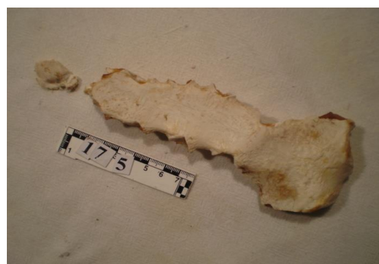
6-расм. Танасини ханжарсимон танаси билан бирлашмаганлиги

Тадқиқот натижаларига кўра, тўш суягининг дастак қисминининг танаси билан ва ханжарсимон ўсиғининг танаси билан бирлашиши жинсидан қатъий