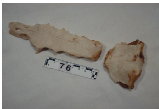
5-расм. Танасини ханжарсимон ўсиғи билан бирлашиши

гача ва аёлларда 40 ёшгача кузатилмаган (4- ва 5-расмларга қаранг).