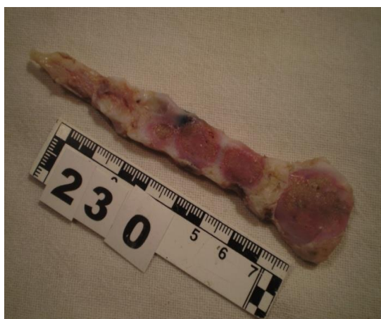
1-расм. Тўш суяги танаси тўлиқ сегментларининг кўриниши

ментлар тўлиқ бирлашади. Бизнинг таҳлилимиз натижаларига кўра, 25 ёшдан ошган деярли барча ҳолларда тўш суягининг танасининг барча сегментлари ўртасида тўлиқ суякланиш жараёни кузатилди. Эркаклар ва аёллар ўртасида тўш суягининг сегментларининг суякланиш жараёни, ёшида диярли ҳеч қандай фарқ кузатилмади (1- ва 2-расмларга қаранг).