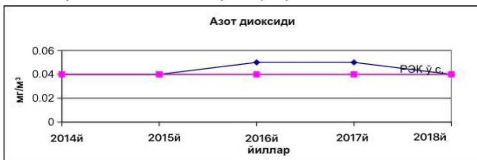
2-диаграмма. Йиллар динамикасида азот диоксида миқдорининг ўзгариши.

Таҳлил натижалари азот оксиди ва озоннинг миқдори эса рухсат этилган концентрациялардан ошмаганлигини кўрсатди (2-жадвал).