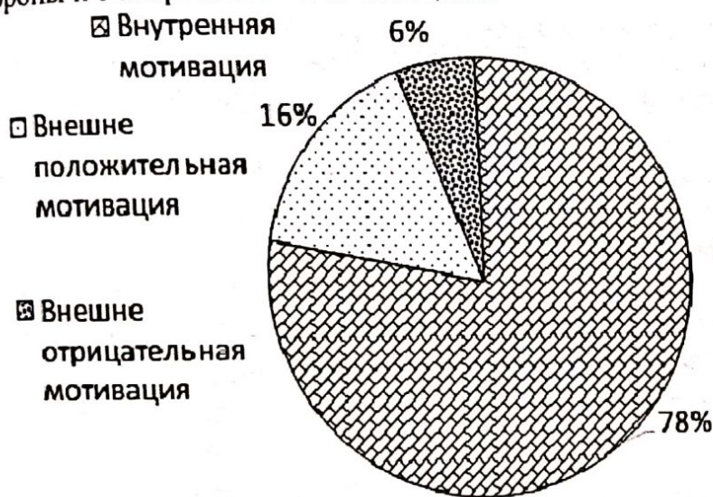
Рис. 3. Результаты исследования профессиональной мотивации по методике К. Земфир в модификации А.Реана

тльности показал, что профессиональная деятельность студентов 6 курса Ташкентской медицинской академии в большей степени соотносится с внутренней мотивацией. Таких обучающихся 25 человек (78,1%). Они заинтересованы именно профессией врача и желают получить профессиональные компетенции в области медицины. Положительная внешняя мотивация выявлена у 5 (15,6%) молодых человек. Они отмечают важность профессии в том, что бы удовлетворить свои социальные потребности, они думают, что профессия врача вызывает уважение, является престижной, а также может принести материальные благо. В меньшей степени демонстрируют внешне отрицательную мотивацию, связанную со стремлением избежать осуждения со стороны и с потребностью самозащиты.