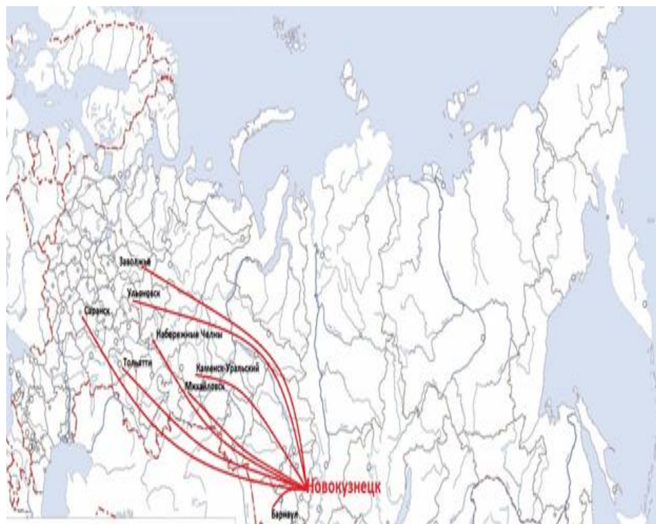
Рис. 1. География поставок АО «РУСАЛ Новокузнецк». Внутренние регионы сбыта

Основным рынком сбыта алюминиевой продукции АО РУСАЛ является Россия. География поставок внутри страны представлена на рис. 1.