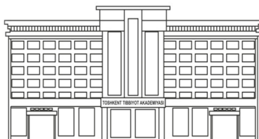
TIBBIYOT NASHRIYOTI MATBAA UYI

Объем – 7,1 а.л. Тираж –30. Формат 60x84. 1/16. Заказ № 1464 -2022. Отпечатано «TIBBIYOT NASHRIYOTI MATBAA UYI» МЧЖ 100109. Ул. Шифокорлар 21, тел: (998 71)214-90-64, e-mail: rio-tma@mail.ru № СВИДЕТЕЛЬСТВА: 7716