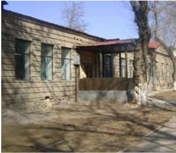
Хирургический корпус ГТС ТСК (1981 г.)