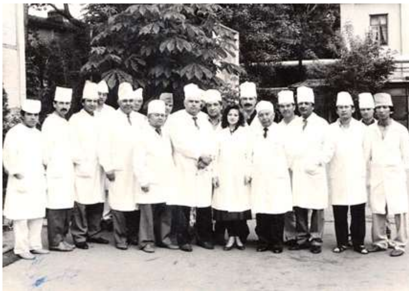
Сотрудники кафедры хирургии (1995).