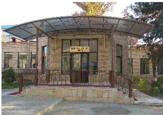
Отделение колопроктологии 1-й Республиканской клинической больницы (2014).

Научные исследования кафедры были дополнены серьезными исследованиями в области колопроктологии. За этот период кафедрой опубликовано более 500 научных работ, 2 учебника, 15 монографий, более 40 авторских свидетельств, 4 докторских и 15 кандидатских диссертаций.