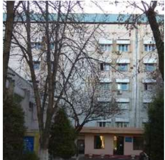
ГТС ТСК (1988).