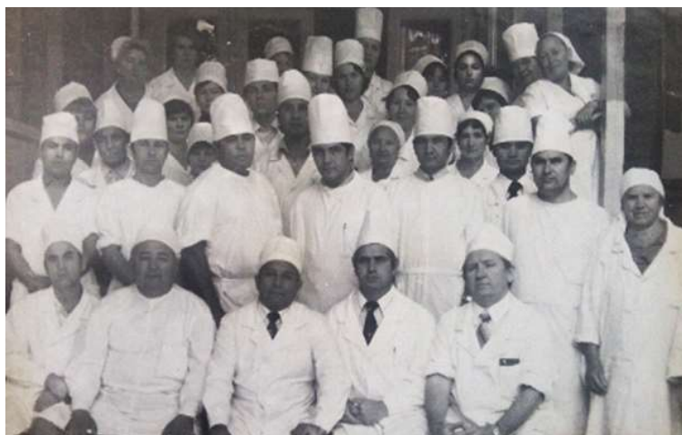
Сотрудники кафедры хирургии, 1980 г.

В 1979 г. кафедра была переведена в ГТС ТСК (Старая Скорая помощь, улица Жуковского, 74).