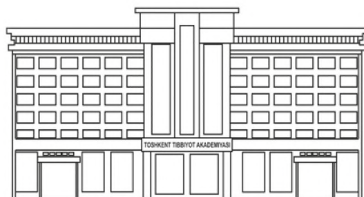
TIBBIYOT NASHRIYOTI MATBAA UYI