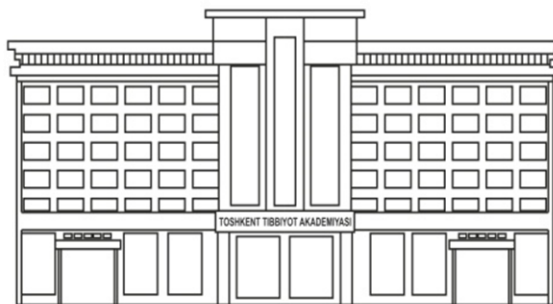
TIBBIYOT NASHRIYOTI MATBAA UYI

Объем – 6,5 а.л. Тираж –20. Формат 60x84. 1/16. Заказ № 2064-2023. Отпечатано «TIBBIYOT NASHRIYOTI MATBAA UYI» МЧЖ 100109. Ул. Шифокорлар 21, тел: (998 71)214-90-64, e-mail: rio-tma@mail.ru № СВИДЕТЕЛЬСТВА: 7716