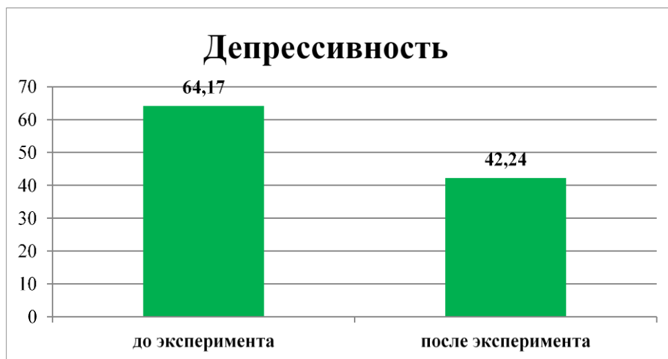
Рисунок 2. Сравнение данных, полученных по шкале Зунге до и после эксперимента, N=30

помогают формированию способности бороться против болезней. Предположение о том, что в результате отрицательных переживаний, долговременных стрессовых ситуаций, связанных с трудовой деятельностью отмечается рецидив болезни, или же, наоборот, через формирование положительных эмоций и адекватного отношения к своей болезни можно снизить у них психоэмоциональное напряжение, подтвердилось.