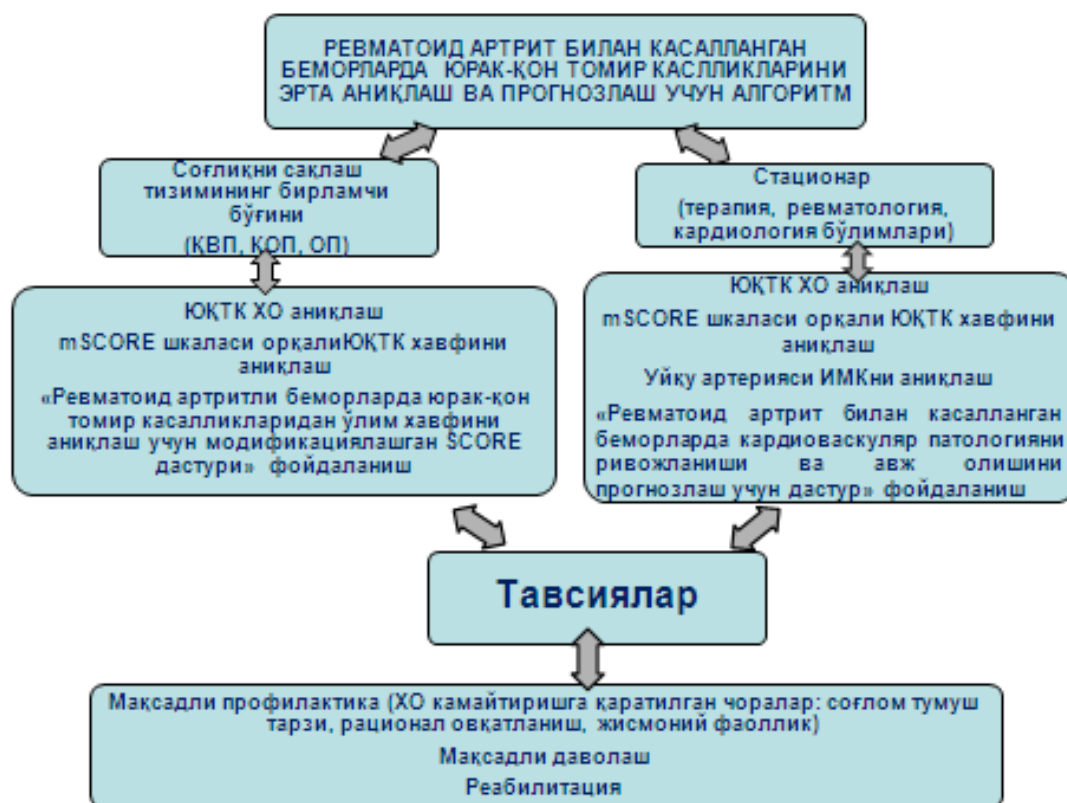
3-расм. Ревматоид артрит билан касалланган беморлар учун юрак- қон томир касалликларини эрта аниқлаш ва прогностлаш алгоритми

ривожланишини аниқлаш мақсадида уйқу артериялари ИМК қалинлигини баҳолаш ҳам катта прогностик аҳамиятга эга.