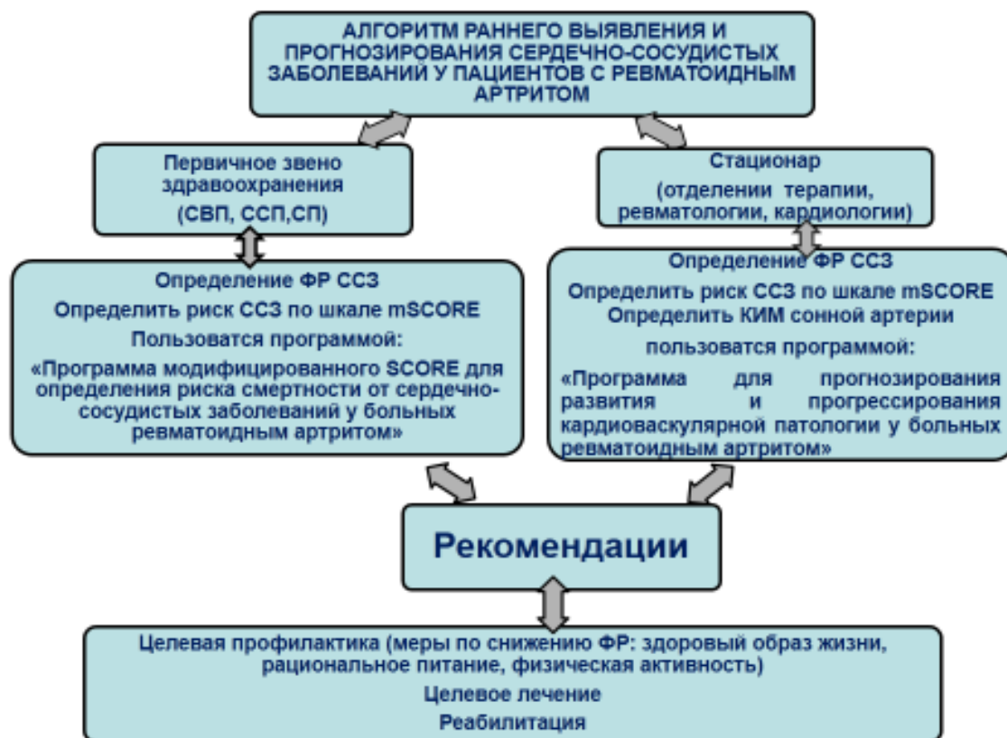
Рис. 3. Алгоритм раннего выявления и прогнозирования сердечно-сосудистых заболеваний у пациентов с ревматоидным артритом

Предоставление необходимых рекомендаций пациентам направлено на достижение предотвращения развития сердечно-сосудистой патологии у пациентов с РА, целевая профилактика включает в себя такие рекомендации, как раннее выявление ФР, их коррекция, т.е. соблюдение принципов здорового образа жизни, объяснение рационального питания, повышение физической активности. Целевое лечение пациентов с выявленными ССЗ и ФР и его сочетание с методами реабилитации способствуют снижению осложнений заболевания.