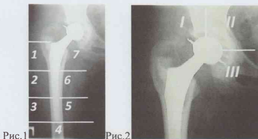
Рис.1. Оценка состояния бедренного компонента по системе Gruen.