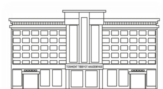
TIBBIYOT NASHRIYOTI MATBAA UYI

Объем – 1,51 п.л. Тираж – 20. Формат 60x84. 1/16. Заказ № 1505-2022. Отпечатано ООО «TIBBIYOT NASHRIYOTI MATBAA UYI» 100109. Ул. Шифокорлар 21, тел: (998 71)214-90-64, e-mail: rio-tma@mail.ru № СВИДЕТЕЛЬСТВА: 7716