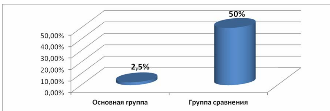
Рис 1. Частота рецидива фолликулярной кисты яичников после цистэктомии у пациенток получивших Дистрептазу

проводили у нижнего края капсулы фолликулярной кисты, далее проникали в слой между стенкой кисты и корковым слоем яичника, в основном отслаивая механическим путем, тем самым, отграничивая стенку фолликулярной кисты от здоровой ткани яичника, проводили непосредственно энуклеацию кисты, частично фиксируя ее щипцами и вылушивая тянущими движениями. В случаях разрыва капсулы кисты и попадания ее содержимого в брюшную полость осуществляли тщательное промывание полости малого таза с антисептическим раствором. После резекции и энуклеации проводили обязательную дополнительную обработку ложа фолликулярной кисты биполярным коагулятором, с целью не только надежного гемостаза, но и коагуляции возможных оставшихся кистозных образований. На последнем этапе еще раз, проводили тщательное промывание брюшной полости антисептическим раствором и ревизию органов брюшной полости. При операции полностью удаляли капсулу, так как оставшаяся ткань способна вызвать рецидивирование процесса. В основной группе частота рецидива составила 2,5% (3 случая). Беременность в основной группе наступила у 77,5% (93 женщин), в группе сравнения у 16,6% (5 женщин). В группе сравнения у 15 (50%) после оперативного лечения в дальнейшем на фоне базовой терапии развился рецидив фолликулярной кисты яичников (Рис 1).