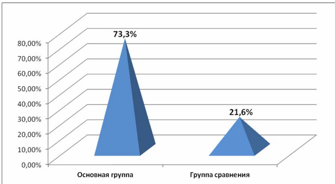
Рис 2. Частота улучшения самочувствия больных после цистэктомии, получавших Дистрептазу в комплексной терапии.

У женщин основной группы, отмечено также улучшение кровообращения в малом тазу, а также у пациенток с варикозным расширением тазовых и геморроидальных вен - оценивалось по отсутствию жалоб и подтверждено ультразвуковым и доплерометрическим исследованиями.